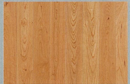
アメリカンブラックチェリー