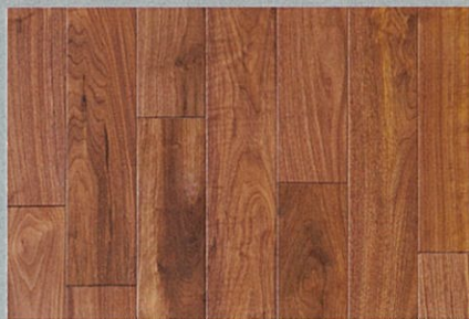
アメリカンブラックウォールナット