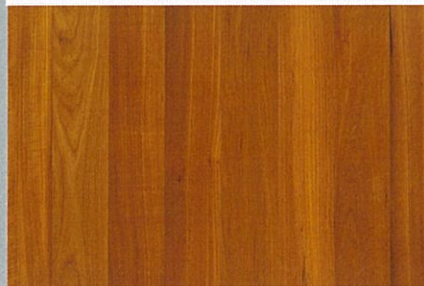
ミャンマーチーク